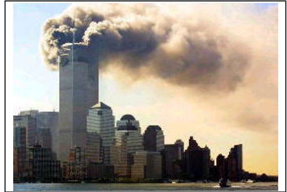
世界貿易センターへの攻撃

経済的な状態も重要です。先進国と発展途上国の格差は大きなものがあります。現代の経済状態が紹介されます。